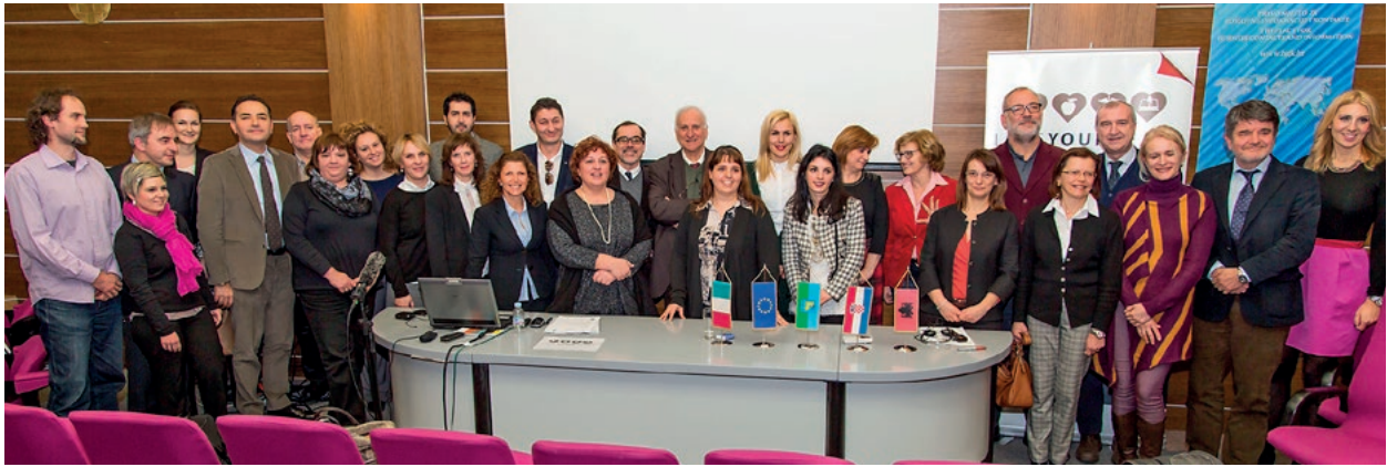
Završna konferencija projekta „Love your heart“

pacijentima bolji su nalazi kontrolnih ergometrija.